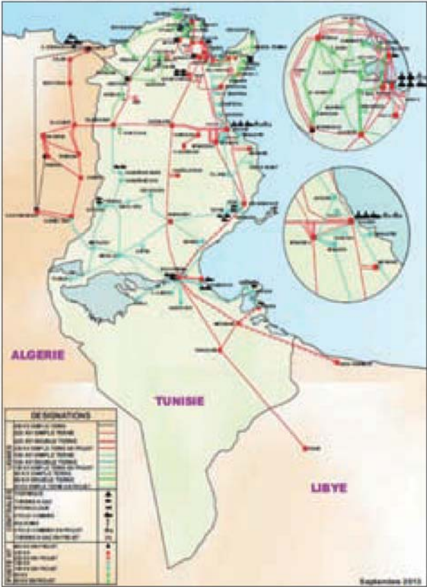
Réseau électrique de transport