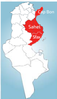
Schéma du réseau de transfert des eaux

*MDT : Millions de Dinars Tunisiens et MUSD : Millions de Dollars USA