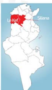
Plan de Situation et bassin versant du barrage Tessa

*MDT : Millions de Dinars Tunisiens et MUSD : Millions de Dollars USA