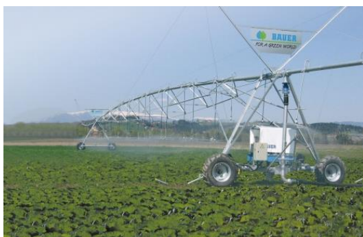
© BAUER Röhren- und Pumpenwerk GmbH

Présent à l'échelle internationale, le groupe Bauer réunit 17 entreprises dans le monde et est un spécialiste des techniques d'irrigation ainsi que de la gestion des déchets et de l'énergie.