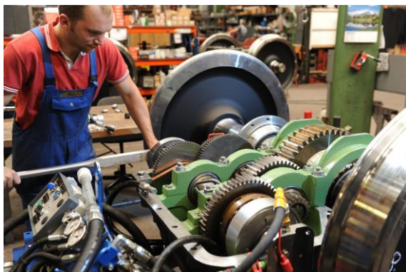
© Plasser & Theurer Export von Bahnbaumaschinen GmbH

Cet équilibre dynamique entre éléments innovateurs et éprouvés est l'une des clés de la rentabilité exemplaire des engins Plasser & Theurer.